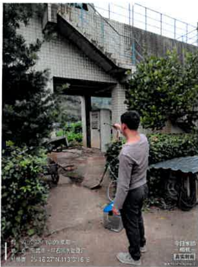
厂区内甲烷浓度最高点5#